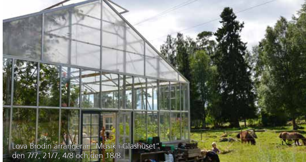
Lova Brodin arrangerar "Musik i Glashuset" den 7/7, 21/7, 4/8 och den 18/8.