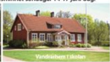
Vandrarhem i skolan